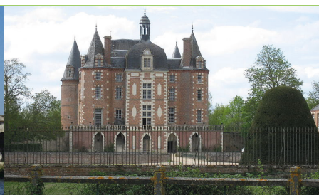
b) Château de la Ferté-Imbault