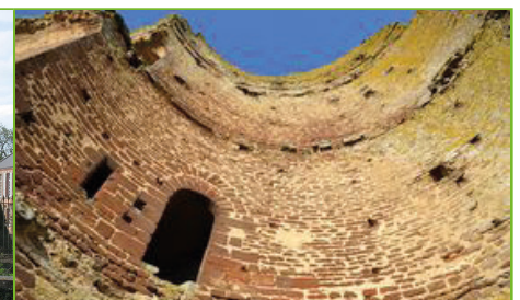
c) Tour de Mondoubleau