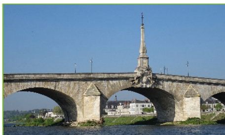
a) Pont Jacques Gabriel à Blois

Quelle photo montre une construction départementale en calcaire de Beauce ?