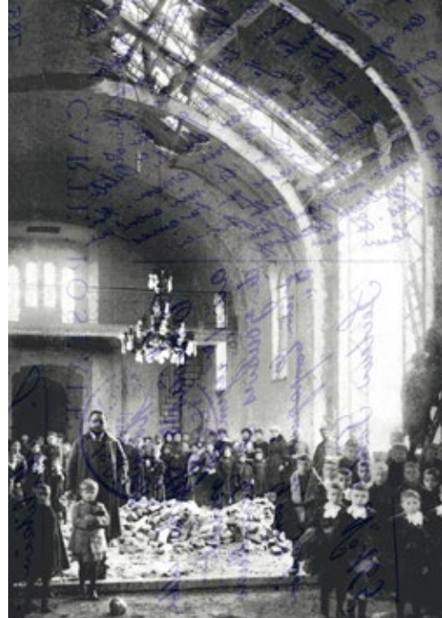
1418. échos, versos et graphies de batailles © Catherine Poncin

Née en 1953 à Dijon, France Elle vit et travaille à Montreuil, France