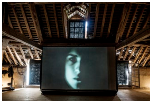
Exposition de Sarah Moon à Zone i