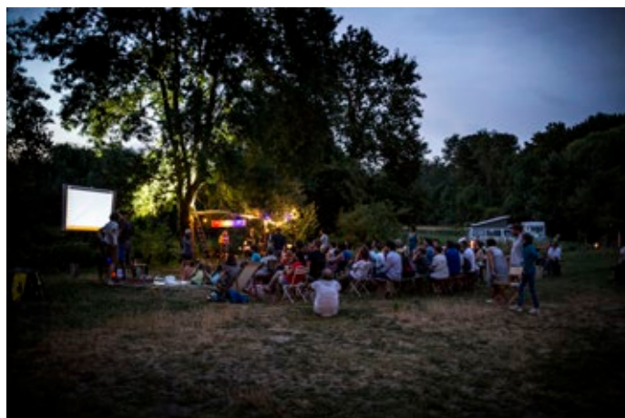
Cinéma en plein air