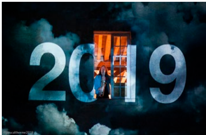
Concert au Moulin de la Fontaine