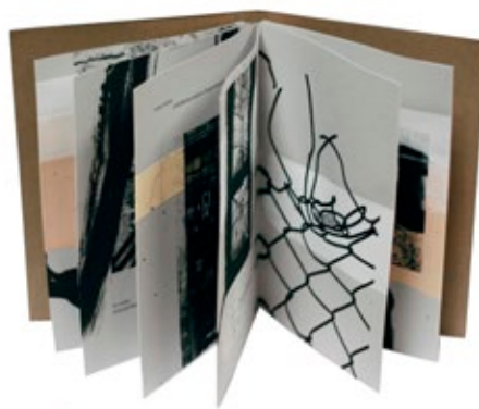
«Blanche» / Retour d'Odessa © Jean-Philippe Mauchien

Née en 1964 à Vendôme, France Il vit et travaille à Azé, France