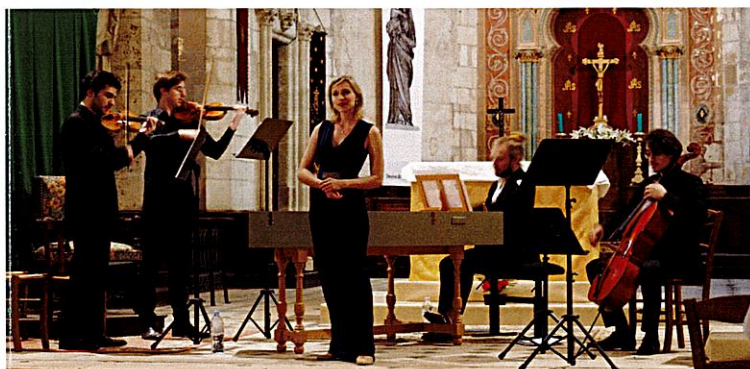
Les solistes de l'Orchestre