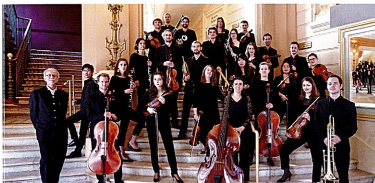
L'Orchestre les Métamorphoses

Cette adhésion vous fait bénéficier notamment du tarif réduit pour toutes les représentations en juillet 2024 et d'informations régulières sur les concerts des Amis de la Musique en Vendômois, ainsi qu'un accès privilégié aux artistes à travers les verres de l'amitié et les dîners qui vous seront proposés après les concerts.