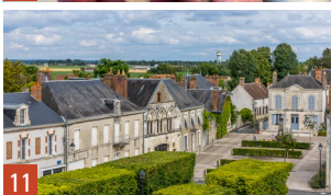
10. Saint-Benoît-sur-Loire, betterave rouge / 11. Saint-Benoît-sur-Loire 11. La Ferté-Vidame, église Saint-Nicolas