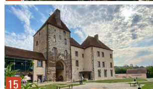
14. Senonches, vue du ciel / 15. Senonches, le château 9. Illiers-Combray, monument funéraire