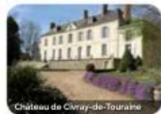
Château de Civray-de-Touraine