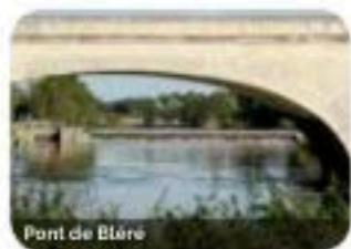
Pont de Bléré