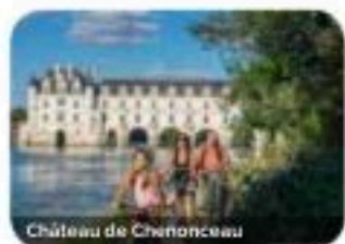
Château de Chenonceau