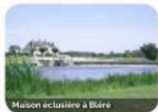
Maison eclusière à Bléré

Illustrations - Credits photos : © D. Dureau ADT37, © L. de Serres