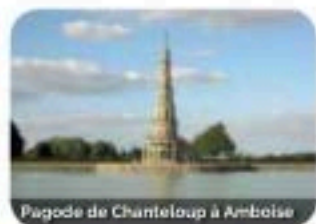
Pagode de Chanteloup à Amboise