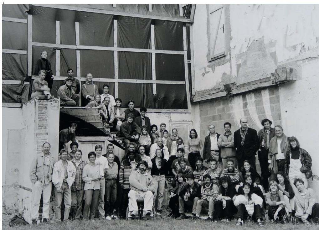
Voyage des comédiens à Dreux- 1998

Réservation obligatoire pour toutes les séances (Odysée + Allez Salut) en ligne sur la site de la Compagnie du Hasard www.compagnieduhasard.com ou par téléphone au 02 54 570 570.