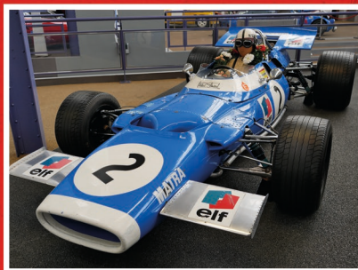
La Matra MS 80