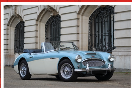
Austin Healey BJ8 3000 1967