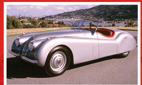
Jaguar XK120 1950