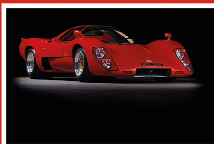
McLaren M6B-GT 1968 Immatriculée à 3 exemplaires