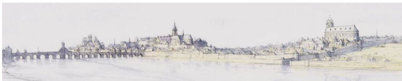
Blois, Essai de restitution de la ville au XVIIe siècle | Vue depuis la rive gauche de la Loire Jean CHEN, aquarelle et crayon, No BL-2, 70 x 25 cm, 2021.