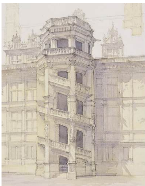
L'escalier monumental et la façade intérieure, château de Blois (état actuel), Jean CHEN, aquarelle, No BL-6, 41 x 31cm, 2022.

Elle offre ainsi un regard sensible et documenté sur la ville telle qu'elle pouvait apparaître à Jeanne d'Arc lors de son passage, tandis que l'ouvrage à paraître prochainement déploie l'ensemble du parcours à l'échelle de la vallée de la Loire et d'autres grandes cités du royaume.