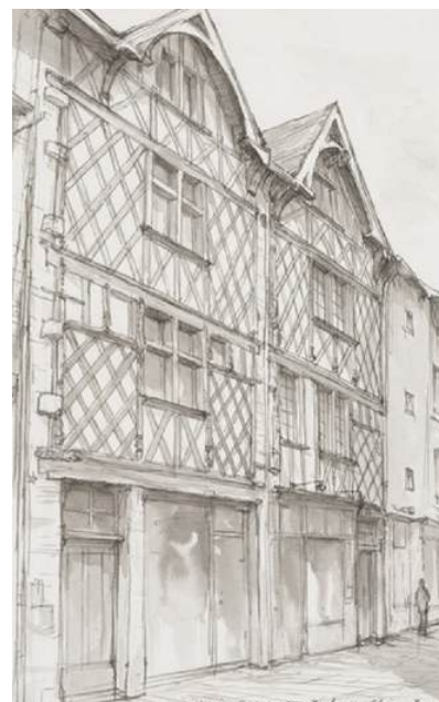
Maisons de Blois (état actuel) Jean CHEN, dessin à la plume et lavé à l'encre, 28 x 21 cm, 2022.