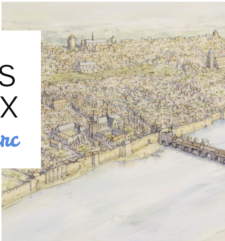
Blois, Essai de restitution de la ville au XVe siècle Vue depuis la rive gauche de la Loire, depuis le sud de Blois Jean CHEN, aquarelle et crayon, No BL-15, 39 x 76 cm, 2024.

En replaçant Blois au cœur de ce parcours, l'exposition invite à suivre la chevauchée de la Pucelle à travers la France médiévale et à comparer les visages des cités qu'elle a connues — un cheminement que l'ouvrage permet d'élargir à l'ensemble des villes traversées.