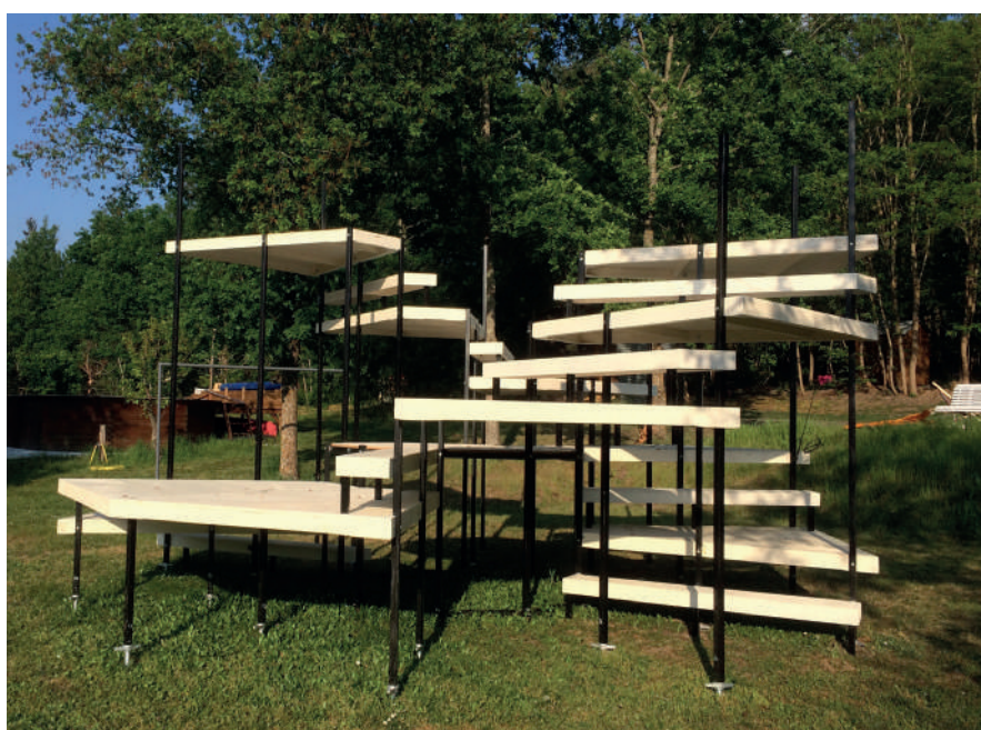
PHOTO DU DÉCOR