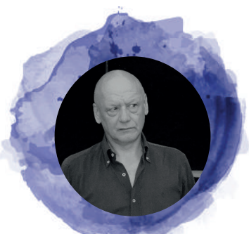
Gigi Bertini ADAPTATION DES CHANSONS TEATRO DUE MONDI